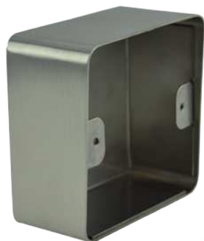
➤ SSP201 ➤ SSP231

➤ Compatibles boîtes d'encastements électriques normalisées