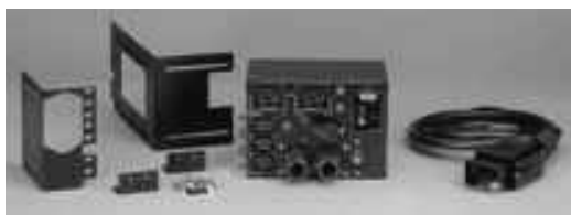
Hotswap MBP6Ki et MBP11ki