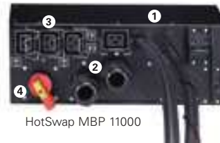
HotSwap MBP 11000