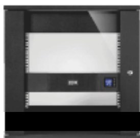
Format faible profondeur pour intégration facile dans de petites armoires