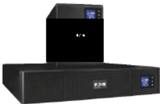
Disponible en format compact