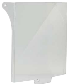
➤ RCP-C Capot de protection double action