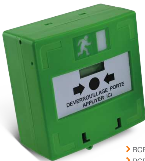
➤ RCP100G ➤ RCP300G