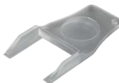
➤ RCP-K Clé de réarmement