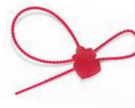
➤ RPS3KG1.2 Lot de 10 pc scellés ("plombs") plastique

IZYX ➤ 1 ou 3 contacts inverseurs ➤ Réarmement en façade