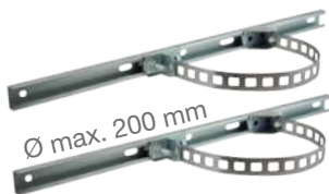
Ø max. 200 mm