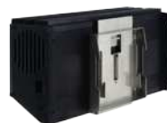
Kit de fixation rail DIN pour module 14M