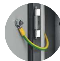
Cordon de mise à la terre 6mm 2 /160mm 6 PSWU-160EW