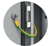
Cordon de mise à la terre 6mm 2 /160mm 6 PSWU-160EW