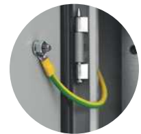
Cordon de mise à la terre 6mm 2 /160mm 6 PSWU-160EW