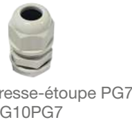
5 Presse-étoupe PG7 CG10PG7