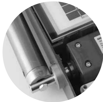
SYSTÈME À RESSORT MÉCANIQUE

Alimentation moteur 12 Vdc Temps de manœuvre 8 s Panneau photovoltaïque (version Parksun) Récepteur S504 incorporé "433 MHz" "FM" "CODES ROLLING"