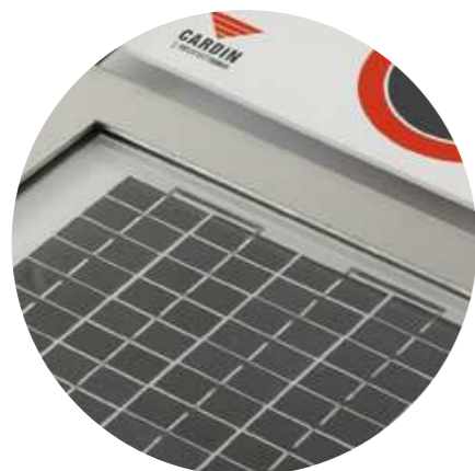
PANNEAU PHOTOVOLTAÏQUE (VERSION PARKSUN)