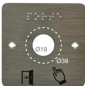
➤ SSP201 ➤ SSP231