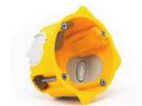
➤ Compatibles boîtes d'encastements électriques normalisées