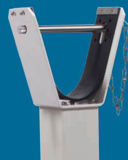
Boulon en acier affiné , pour cadenas à la lyre de repos (en option, cadenas non inclus à la livraison)