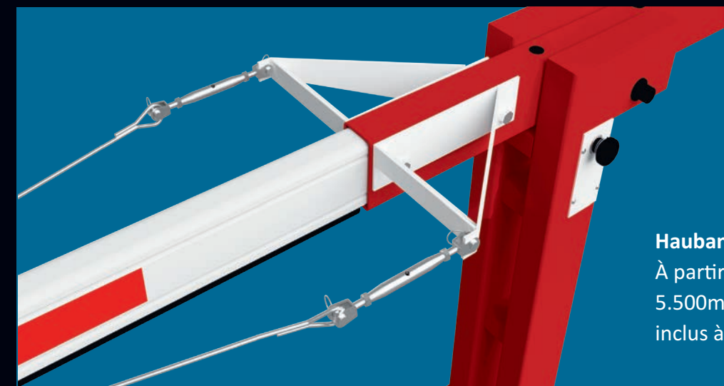
Haubanage À partir de la EH 55L (fermeture 5.500mm) un haubanage est inclus à la livraison

* À partir de la EH 40L (fermeture 4.000mm), soit une lyre escamotable soit une lyre de repos est obligatoirement nécessaire