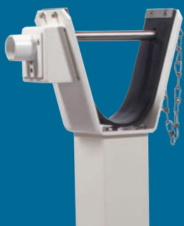
Serrure triangulaire pour pompier , montée à la lyre de repos (en option)

*Versions 2 et 4 sont livrées avec clé prisonnière