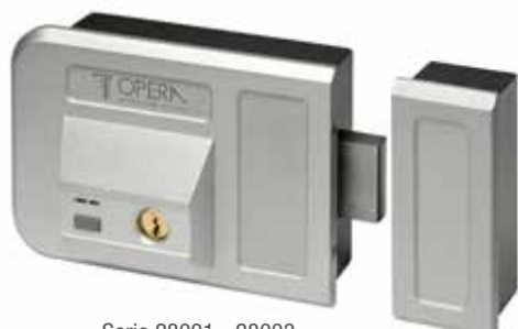
Serie 28001 - 28003